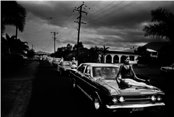
Babinda Harvest Festival, Qd 2003

Trent Parke was born in 1971 and raised in Newcastle, New South Wales. He began taking pictures when he was around 12 years old. Today, Parke, the only Australian photographer to be represented by Magnum Photos, works primarily as a street photographer. Coming Soon is an exploration of urban spaces in colour.